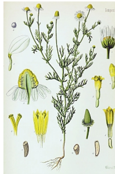
matricaria chamomilla L.

Die Laubblätter sind 4 bis 7 cm lang und zwei- bis dreifach fiederteilig. Die einzelnen Zipfel sind schmal linealisch, knapp 0,5 mm breit, und tragen eine Stachelspitze.