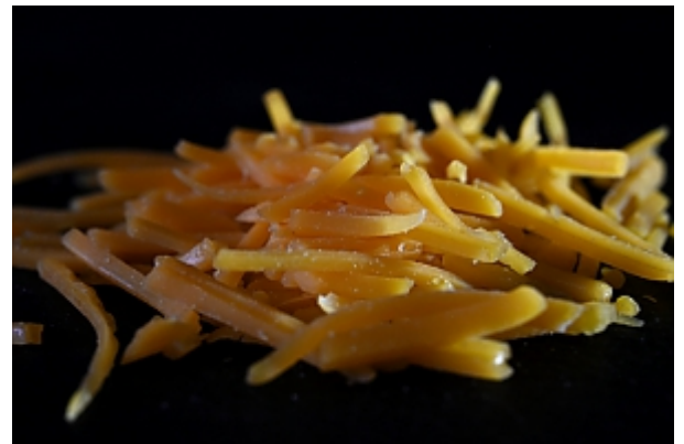
Cheddar Käse, in Streifen geschnitten